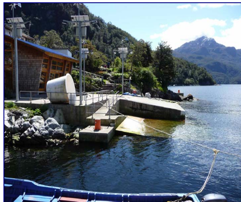
VISTA DE PUERTO GALA, ISLA TOTO

Los resultados de los estudios básicos se utilizan como input para los estudios de maniobrabilidad de la rampa ubicada en Puerto Gala.